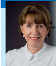
Henriette Reker Oberbürgermeisterin der Stadt KÖLN

„Die Zukunft der Kinder und Jugendlichen – und damit die Zukunft Kölns – hängt entscheidend davon ab, dass sie von klein auf die Zuwendung, Unterstützung und Förderung erfahren, um ihre Zukunft selbst gestalten zu können. Und das unabhängig davon, in welchem Umfeld sie aufwachsen. Daran arbeiten wir tagtäglich. Ich unterstütze und begleite den Prozess, Inhalte und Strukturen in der Stadtverwaltung als Querschnittsthema weiter zu entwickeln. Kinder und Jugendliche sollen ihre Ideen einbringen und partizipieren können, immer dann, wenn es um ihre Belange geht.“